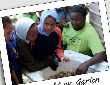
Unterricht im Garten

Der Freiwilligendienst findet im Rahmen des weltwärts-Programms des Bundesministeriums für wirtschaftliche Zusammenarbeit und Entwicklung (BMZ) statt und wird von diesem gefördert.