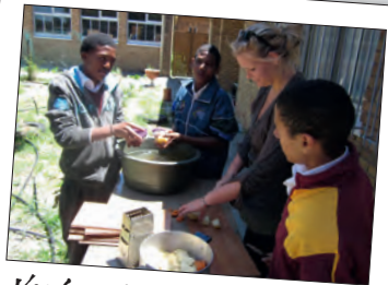
Vorbereitungen zum Essen