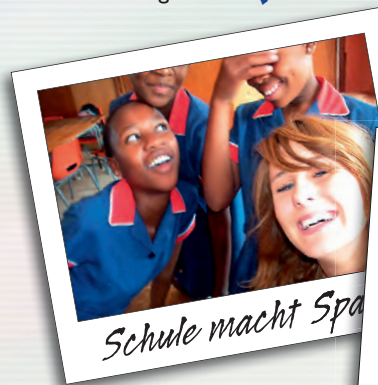
Schule macht Spaß

Wir verarbeiten unsere Erkenntnisse aus dem weltwärts-Freiwilligendienst in der Forschung und in der Entwicklung unserer Programme. ✓